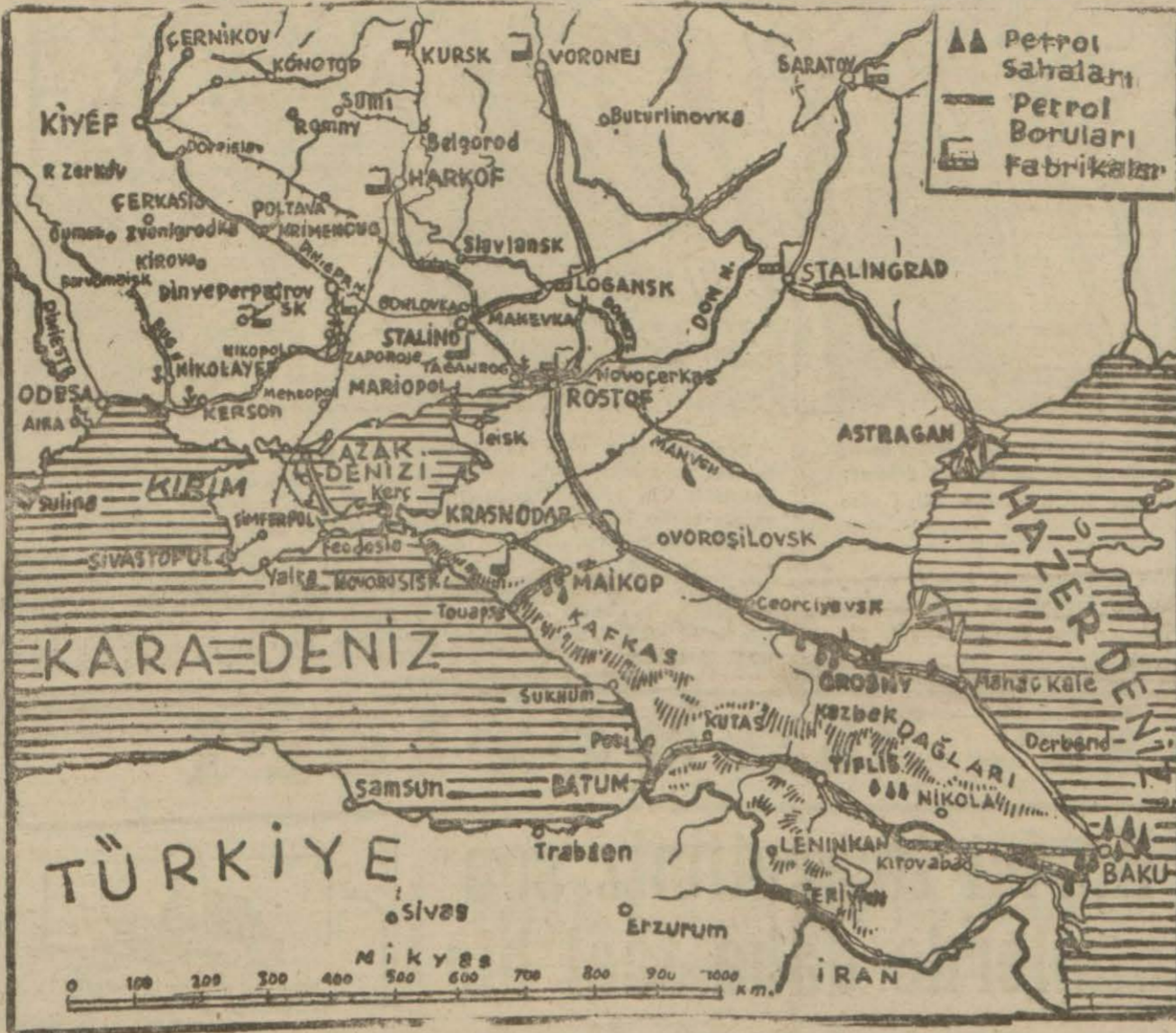
Sovyet cephesinin cenub kısmını gösterir harita

Londra 7 (A.A.) — İngiltere harid, ye nazırı Eden ile Birleşik Amerika cümhurbaşkanı Ruzvelt İhtilâlin yıldönümü münasebetiyle Staline tebrik telgrafları göndermişlerdir.