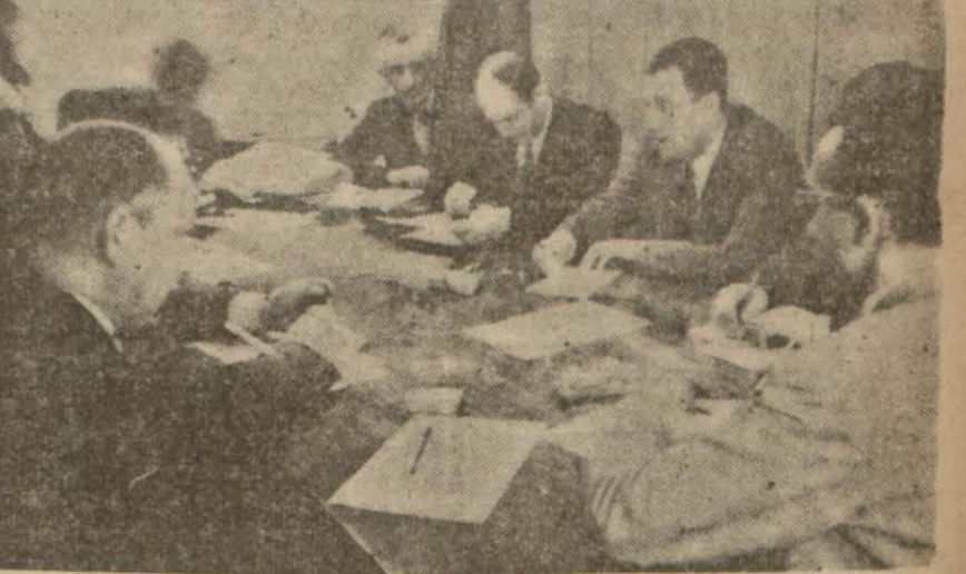
Fiat Mürakabe Komisyonu dünkü toplantısında

Mezbahaya az hayvan sevkettikleri, el altından yüksek fiatla et sattıkları anlaşıldı